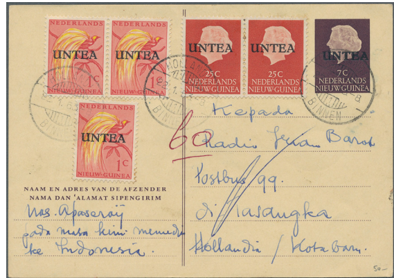
ex Los 78