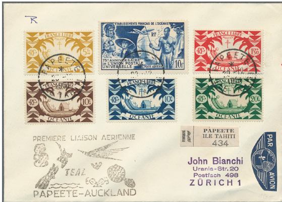
ex Los 77