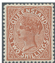
ex Los 72