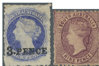
ex Los 73