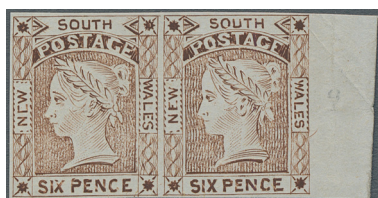
ex Los 70